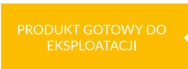
PRODUKT GOTOWY DO EKSPLOATACJI