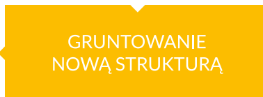
GRUNTOWANIE NOWĄ STRUKTURĄ