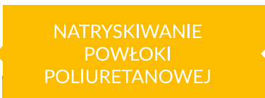
NATRYSKIWANIE POWŁOKI POLIURETANOWEJ