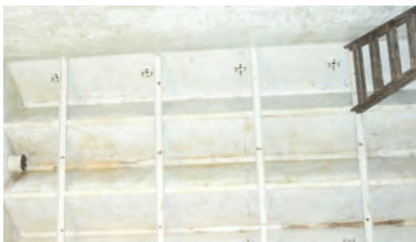
CZYSZCZENIE I MATOWIENIE